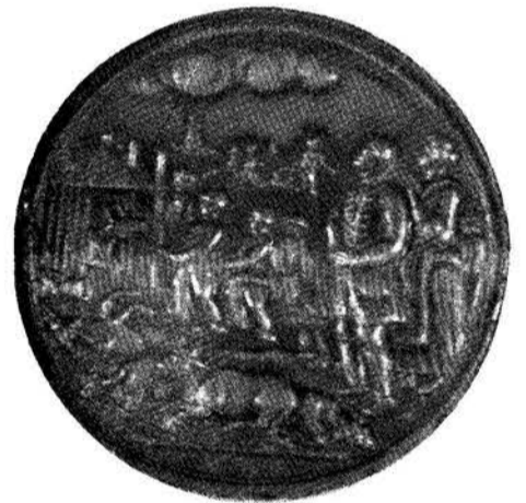
Gedenkpenning op de runderpest in 1747.

De roggebouw, de bedrijven van den scheper en den iemker op de toen nog bestaande heidevelden, de turftrapperij en de turfstekerij, de vischvangst,