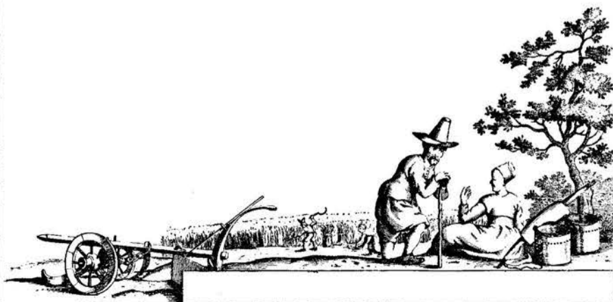
Petear twisken bouboer en in melkster.

In een anderen graveur die de kaarten van Oost-Dongeradeel, Dantumadeel, Baarderadeel, Hennaarderadeel , en Aengwirden heeft versierd zou ik een localen kunstenaar willen zien, die in Friesland wonende en van Friesche afkomst althans met de Friesche boereomgeving geheel op de hoogte is geweest. Stijlcritisch is deze Friesche graveur te herkennen aan de bij-