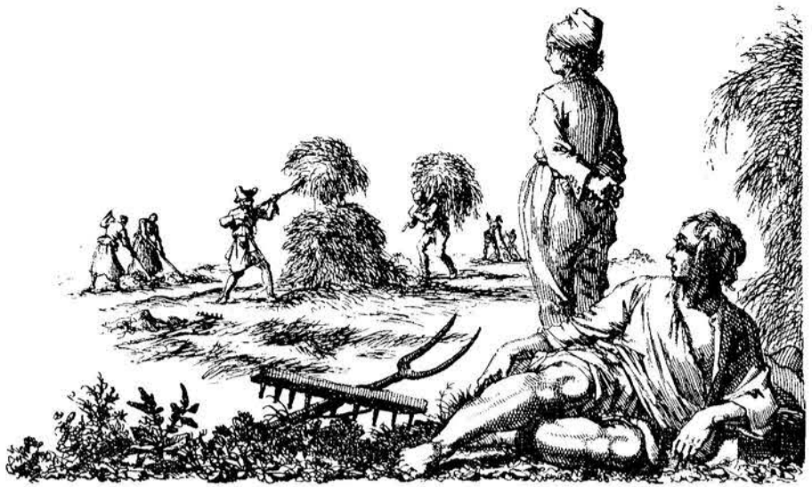
Yn 'e ûngetiid om 1700 hinne.

Toen de Staten van Friesland in 1682 de opdracht verstrekten tot het maken van dezen atlas, werden voor de randtekeningen de meest populaire Hollandsche graveurs uit dien tijd de Gebroeders Casper en Jan Luyken aangezocht. Door Casper Luyken werden in 1682 en 1685 behalve de titelprent versierd de kaarten van Oud-Friesland en die van de Grietenijen Leeuwarderadeel, Ferwerderadeel, Schoterland, Oost- en West-Stellingwerf , door Jan Luyken tusschen 1684 en 1694 de Grietenijen West-Dongeradeel, Kollumerland, Achtkarspelen, Tietjerksteradeel, Smallingerland, Idaarderadeel, Rauwerderhem, Franekeradeel, Hemelum Oldevaart (waaraan de afbeelding van de ûngetiid is ontleend), Het Bildt, Uttingeradeel, Lemsterland en