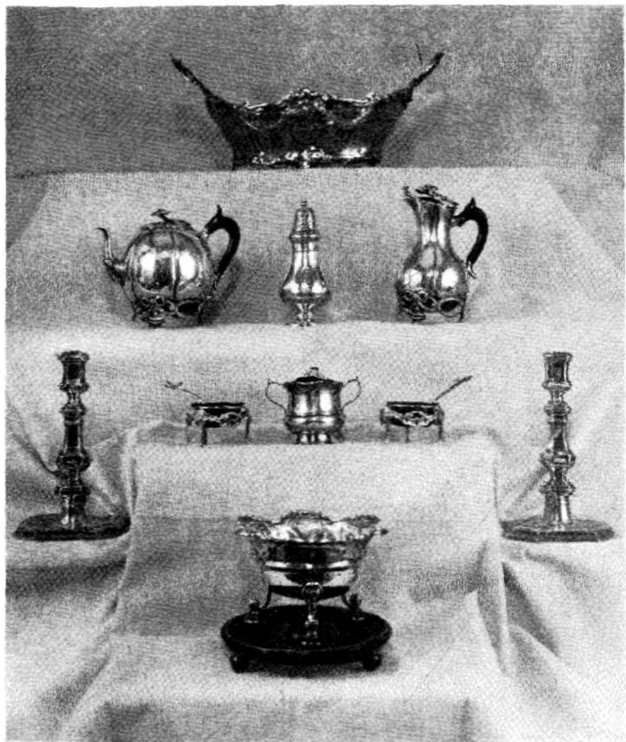
Afb. 8. Zilveren voorwerpen, vroeger gebruikt geweest op Friesma—State, thans in het Princessehof.