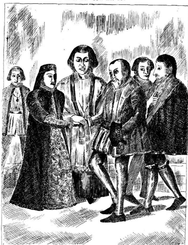
Huwelijk van Leeuwarder echtpaar, 1570.